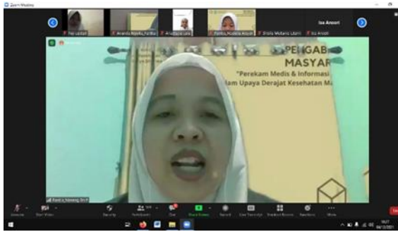
Gambar 1. Foto MC Acara Pengabdian Masyarakat 04 Desember 2021