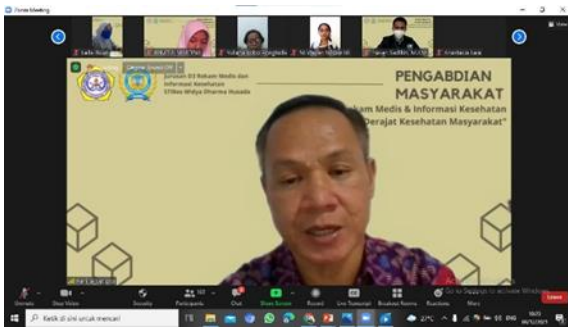
Gambar 2. Foto Moderator Acara Pengabdian Masyarakat 04 Desember 2021