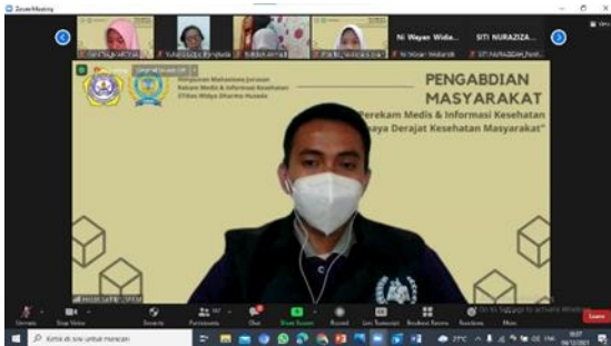
Gambar 3. Foto Narasumber Acara Pengabdian Masyarakat 04 Desember 2021