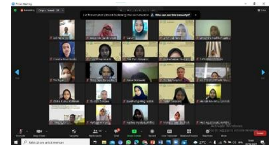
Gambar 4. Foto Peserta- Acara Pengabdian Masyarakat 04 Desember 2021