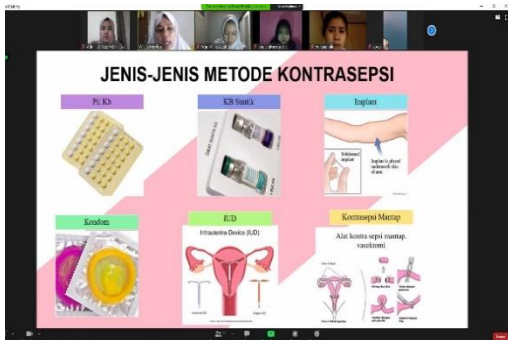
Gambar 1. Materi Edukasi tentang jenis-jenis metode kontrasepsi

Kegiatan telah dilaksanakan sesuai dengan yang telah dijadwalkan tim pengusul yaitu hari Sabtu / 28 November 2020 pada pukul 10.00– 11.00 WIB. Selama pelaksanaannya tim utama kegiatan ini terdiri atas lima orang dosen dari STIKes Widya Dharma Husada. Rundown kegiatan diawali dengan pembukaan oleh moderator serta pengisian absensi peserta, penyajian materi dan kegiatan tanya jawab, kemudian kegiatan ditutup oleh moderator.