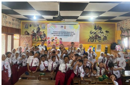
Gambar 5 Penutupan

Kegiatan terakhir adalah penutupan dari guru wali kelas dan foto bersama.