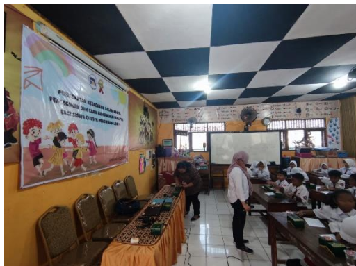
Gambar 2 Pengisian Pretest Bullying oleh Siswa

dalam pembuatan kuesioner dan menyebarkan pretest kepada siswa.