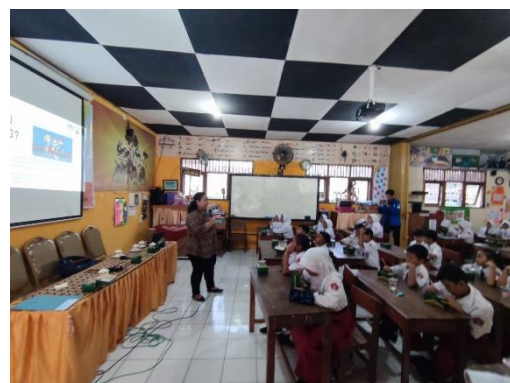
Gambar 3 Penyuluhan Pencegahan dan Cara Menghadapi Bullying di Sekolah

Pemaparan selanjutnya adalah terkait dengan pihak yang terlibat dalam bullying tidak hanya korban, tetapi juga ada pelaku dan juga saksi bullying . Dalam materi ini juga dijelaskan tindakan apa yang harus diambil jika kita menjadi korban maupun saksi yaitu harus berani untuk melapor kepada guru maupun orang tua serta tidak diperbolehkan untuk berbalik merunding pelaku bullying .