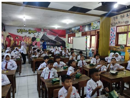
Gambar 4 Pengerjaan Post Test

Kegiatan setelah penyuluhan adalah pengerjaan post-test untuk mengetahui tingkat pemahaman siswa dari materi yang telah disampaikan.