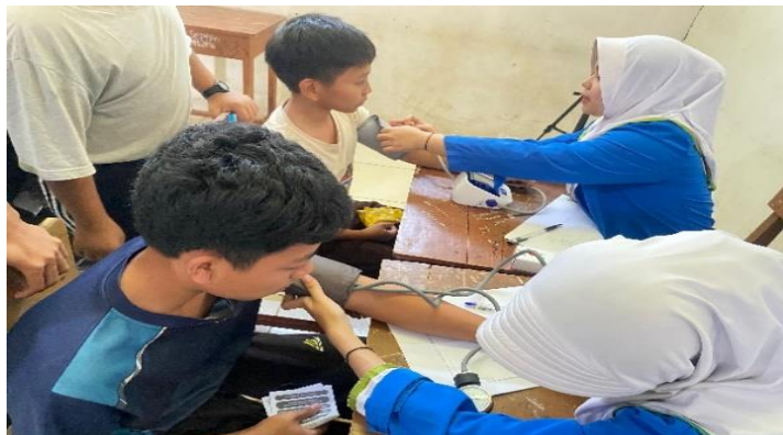
Gambar 4. Pemeriksaan Fisik ( TTV, BB, TB )