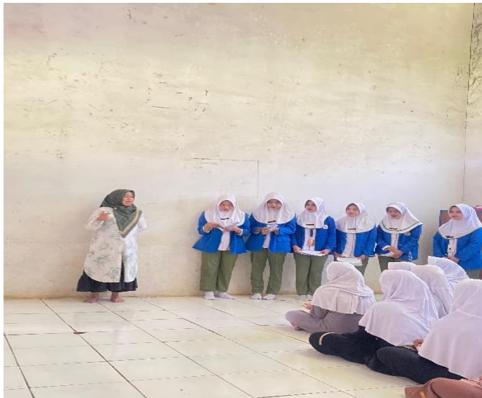
Gambar 1. Penyuluhan kesehatan reproduksi