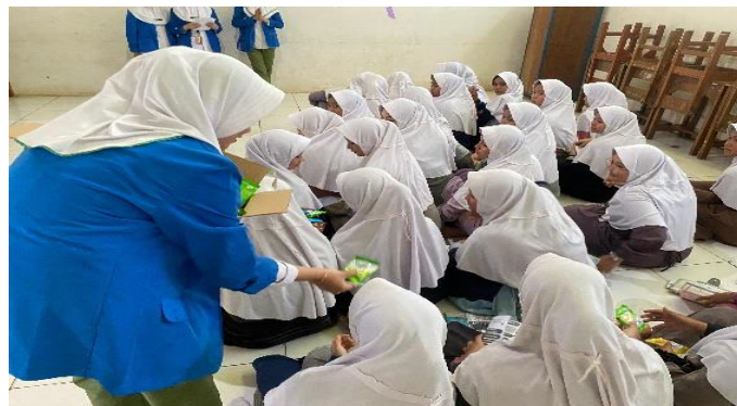
Gambar 2. Pembagian tablet Fe ( Penambah Darah )