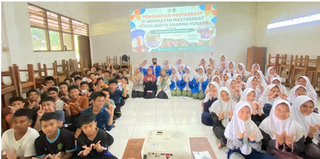
Gambar 5. Foto Bersama tim Pengabdian masyarakat dan remaja