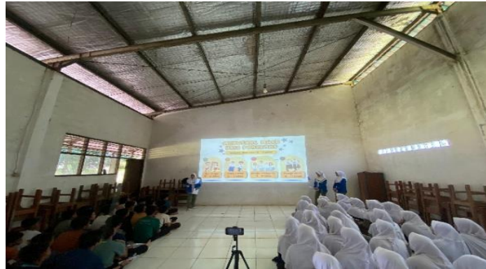
Gambar 3. Penyuluhan tanda-tanda pubertas